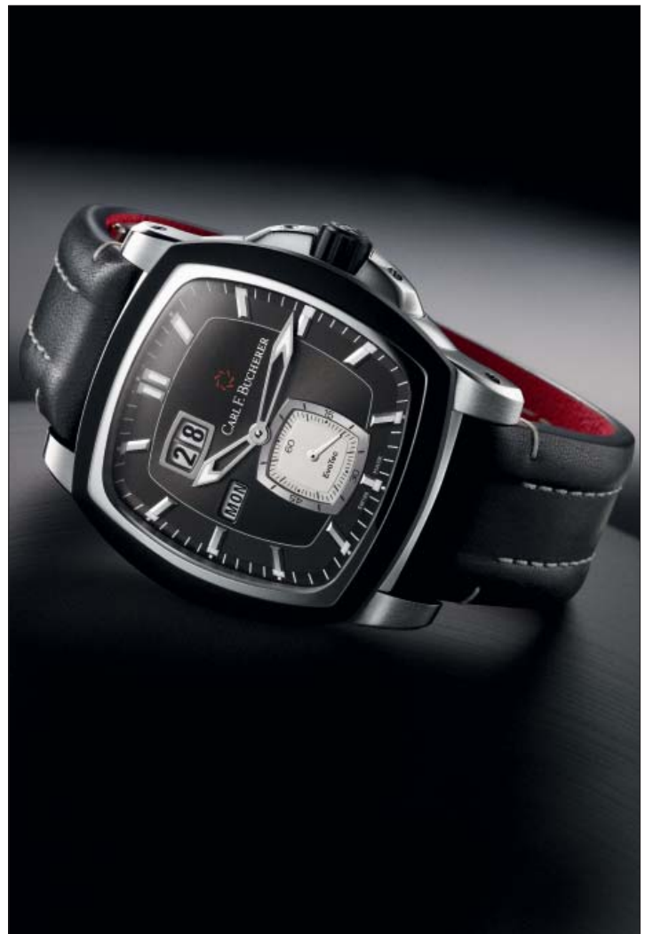
La nouvelle Patravi EvoTec DayDate de Carl F. Bucherer.