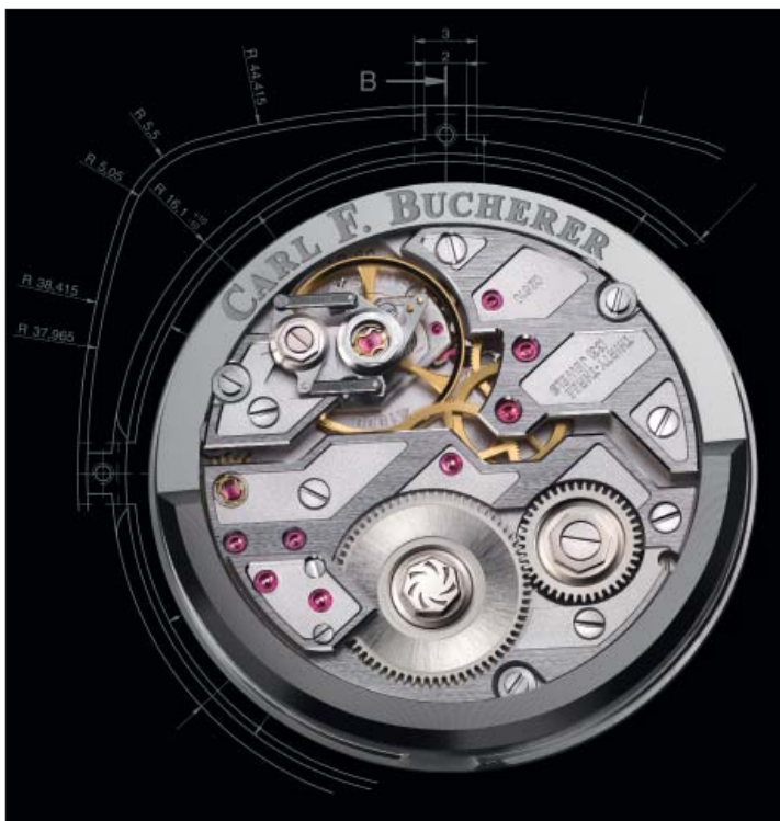
Le mouvement de manufacture révolutionnaire avec masse périphérique – le CFB A1000 de Carl F. Bucherer.

qui n'est plus sous la protection d'un brevet a été exclu dès le début. Par ailleurs, l'équipe s'est fixée très tôt sur un mouvement automatique innovant avec des caractéristiques de construction uniques. Le résultat: le calibre CFB A1000 est l'expression d'une philosophie qui marque une ère nouvelle, grâce à des développements créatifs, comme la masse oscillante disposée à