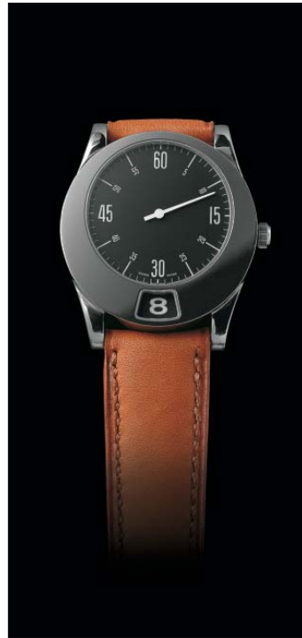
BiTime Eccentric South, 1989.

La «BiTime» présentait une heure sautante, mais pas comme les autres. Elle n'avait pas été conçue comme un exercice de virtuosité mécanique, mais plutôt dans l'esprit d'explorer une façon différente de lire le temps.