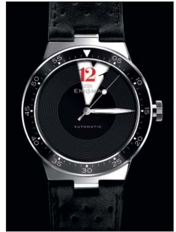
Genius en acier.

Un disque ultraléger en avional affichant une ouverture avec un angle de 42 degrés remplace l'aiguille des heures. Cette fenêtre «encadre» les chiffres, «glissant» d'une heure à l'autre avec une progression continue. Les aiguilles des minutes et des secondes accomplissent leur fonction comme dans une montre traditionnelle. «Genius» est la montre qui change son visage selon l'heure.