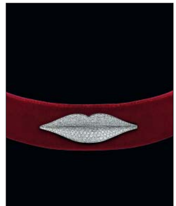
Choker Lips en or gris et diamants.