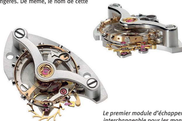
Le premier module d'échappement interchangeable pour les montres-bracelets de H. Moser & Cie.