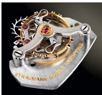
Echappement Straumann Double Hairspring – deux ressorts spiraux de balancier pour compenser l'erreur due à la force de gravité.

A la fin de sa période d'apprentissage et de compagnonnage, en 1826, Heinrich Moser réfléchit à la meilleure façon et au meilleur lieu pour bâtir une carrière. Il aspire à introduire le système de partage du travail des manufactures dans sa ville natale de Schaffhouse en fondant une petite horlogerie, mais le Conseil municipal de l'époque rejette sa demande pour accorder le poste honorifique d'horloger de la ville à quelqu'un d'autre. Heinrich Moser émigre alors à Saint-Petersbourg, en Russie, pour y fonder fin 1828 l'entreprise commerciale «Heinrich Moser & Co.». Il utilise ce nom d'entreprise pour développer une signature sociale en cursive – presque toujours complétée par un poinçon. A quelques exceptions près, le nom d'entreprise en écriture cursive cyrillique et/ou latine et le poinçon signent jusqu'en 1918 environ toutes les montres provenant du négoce horloger de Heinrich Moser, qu'il s'agisse de pièces de sa production propre ou de provenance étrangère.