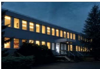
La fabrique horlogère Moser Schaffhausen AG.

En 1829, Heinrich Moser fonde une horlogerie au Locle, qui fabrique des montres de poche destinées au com-